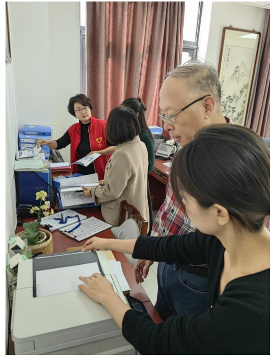
组织教师试讲、认真准备材料（中医学院、管理学院）