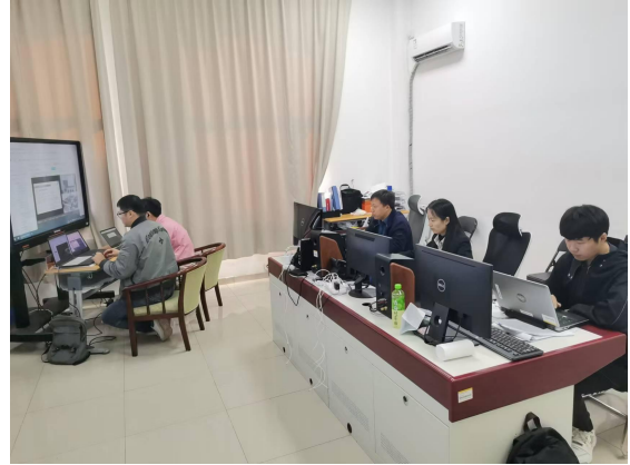
保障听课看课有序进行